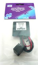
DEI620V EL スキャナ DEI620C EL スキャナ