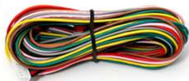
CN1 12ピンハーネス 1セット