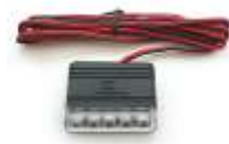
DEI 629L ブルーLED スキャナ