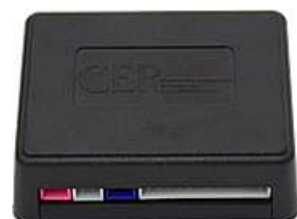
コントローラ(緑1) 1個