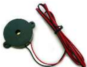
電子ブザー 1セット