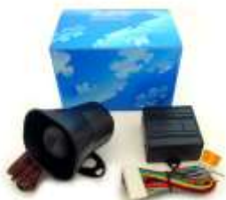
DEI 516U ボイスモジュール