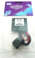
DEI620V EL スキャナ DEI620C EL スキャナ