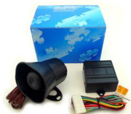
DEI 516U ボイスモジュール