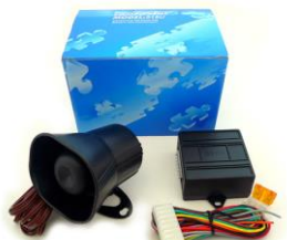
DEI 516U ボイスモジュール