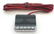
DEI 629L ブルーLED スキャナ