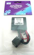
DEI620V EL スキャナ DEI620C EL スキャナ