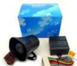
DEI 516U ボイスモジュール