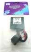
DEI620V EL スキャナ DEI620C EL スキャナ