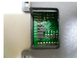
左の写真はJP3が外れていてJP4、JP5が付いている例