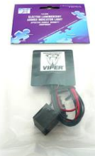
DEI620V EL スキャナ DEI620C EL スキャナ