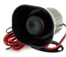
サイレン 1セット 購入されたタイプによってサイレンが異なります。