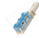
接続コネクタ(青) 2個

コネクタや端子の使用方法はこちら http://cepinc.jp/chumon/torisetsu/connector.html