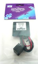
DEI620V EL スキャナ DEI620C EL スキャナ