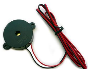
電子ブザー 1セット