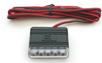
DEI 629L ブルーLED スキャナ