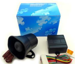
DEI 516U ボイスモジュール