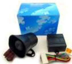
DEI 516U ボイスモジュール