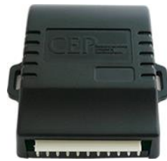
コントローラ(水色2) 1個