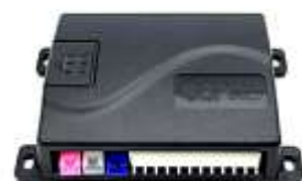
コントローラ(黄緑) 1個