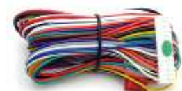
メインハーネス 1セット