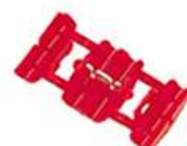
割込コネクタ(赤) 7個