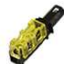
接続コネクタ(黄) 8個 (オス・メスの区別はありません)