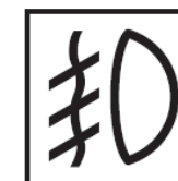
フォグランブが自動 ON